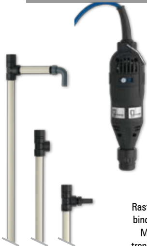
Rastverbindung Motor trennbar

NEU - handliche Pumpe für viele Anwendungen